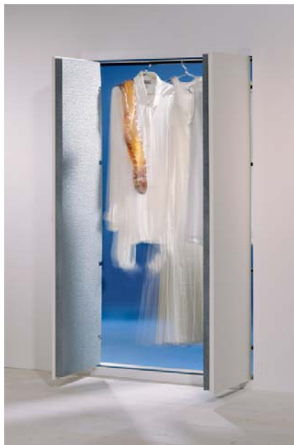
Afbeelding: maatwerk, dubbele uitvoering, 4 scharnieren, warmte geïsoleerd